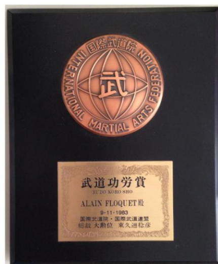
Photo 4 – « Budo koro sho » décerné en 1983 à Me Alain Floquet par son excellence le Prince Impérial Naruhiko Higashi Kuni, Oncle de l'empereur du Japon (FIAM)