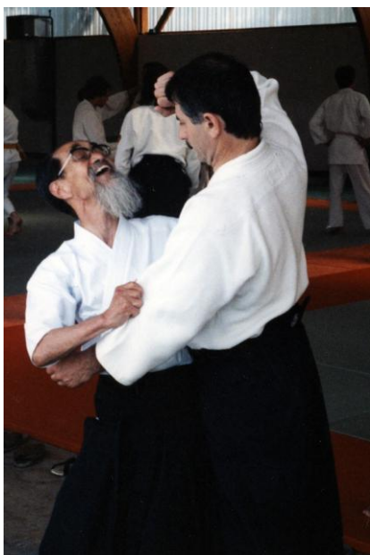
Photo 7 - Avec Sugino Yoshio Sensei - souvenirs du judo Kodokan à Temple sur lot

qui m'ont imprégné de leur exemple et permis de remonter à une source essentielle du Budo japonais. Ainsi, Minoru Mochizuki Sensei, Yoshio Sugino Sensei (photo 7) et Takeda Tokimune Sensei (photo 8), Soke du Daito Ryu Aïki-jujutsu*, m'ont accordé leur confiance et transmis leur enseignement.