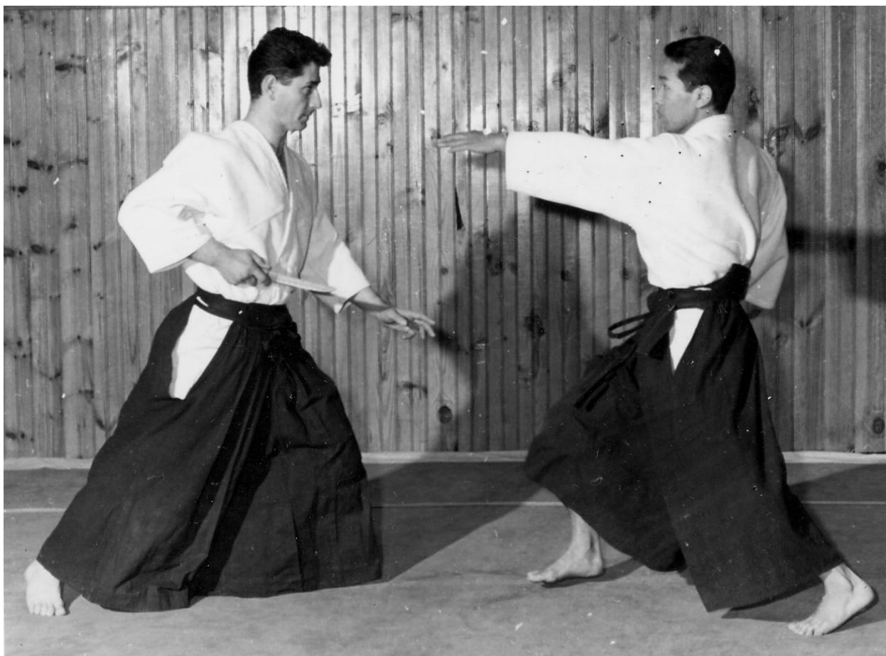
Photo 1 - Avec Hiroo Mochizuki Sensei - Paris (Plage 50) vers 1966