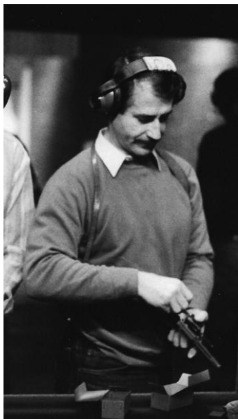
Photo 10 - Entraînement Brigade Anti Commando (B.A.C) arme 357 magnum - Stand CP5

Enfin, l'Aïkibudo a également une nature et une construction pragmatiques, issues de mon expérience de vie, construite mentalement et physiquement sur le terrain de la violence où le geste (ou l'action) ne peut être simulé (photos 10 et 11), l'intervention simplement tentée et la vigilance prise en défaut sous peine de risques irréversibles tant pour l'intégrité physique que pour la vie.