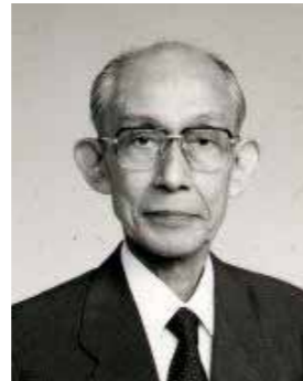
Portrait "Kishomaru" (fils de O Sensei)

Moriteru est destiné à confier son titre de doshu à son fils, Mitsuteru appelé Waka sensei.