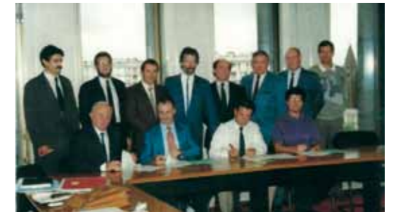
Signature de l'accord FFAAA-FFAB, le 22 septembre 1990 au Ministère des sports à Paris portant création de la Commission Spécialisée Des Grades d'Aïkido