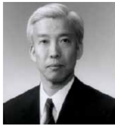
Portrait Ueshiba Moriteru